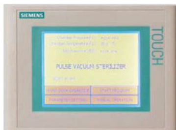
Écran tactile SIEMENS