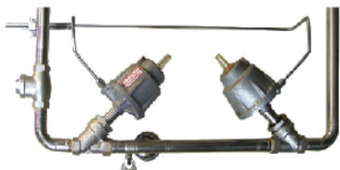
Le système de conduites adopte tuyaux sanitaires en acier inoxydable et soupapes pneumatiques de marques mondiales