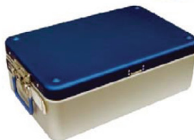
Réceptif de stérilisation