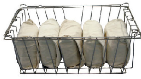
Panier de stérilisation