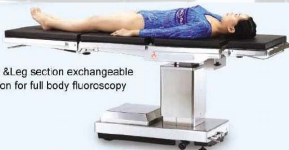
Head & Leg section exchangeable function for full body fluoroscopy