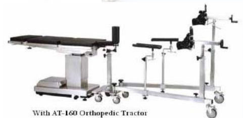
With AT-160 Orthopedic Tractor