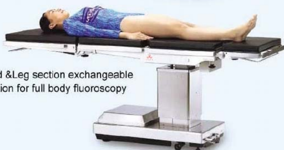
Head & Leg section exchangeable function for full body fluoroscopy